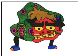
S4. 獅子舞 (堀井銀次)