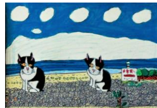
S6. 海とねこ (西須奈津子)