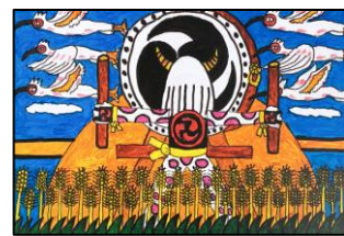
S2. 朱鷺と鬼太鼓の島・佐渡 (前田優作)