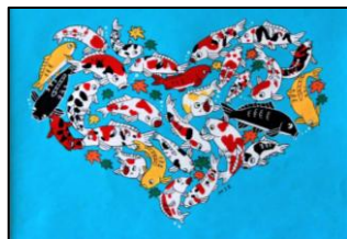
S3. 山古志の錦鯉たち ハートの形 (田中翠恵)