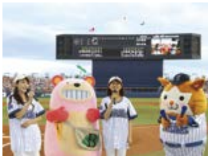
横浜DeNAベイスターズ VS 読売ジャイアンツ (ハードオフエコスタジアム新潟 8月5日)