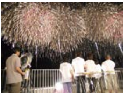
水曜見ナイト 「長岡花火2時間SP」

この結果、テレビ部門の収入は、前年同期比1.7%増の26億3千7百万円となりました。