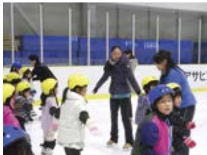
BSNスケートフェスティバル (新潟アサヒアレックスアイスアリーナ 7月26日)

当期後半につきましては、消費税増税の先送りが見込まれる一方で、円安に伴うエネルギー、原材料価格の上昇などにより景気は不透明感が払拭できない状況で推移するものと予想されます。放送収入の支柱であるテレビスポット広告の出稿量も流動的で、その他の事業における競争もこれまで以上に激しくなるものと思われま