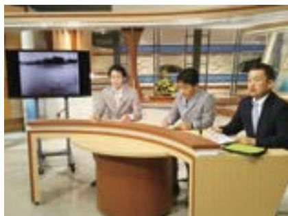
新潟地震50年 「先人に学ぶ 今こそ遺したい新潟地震の教訓」