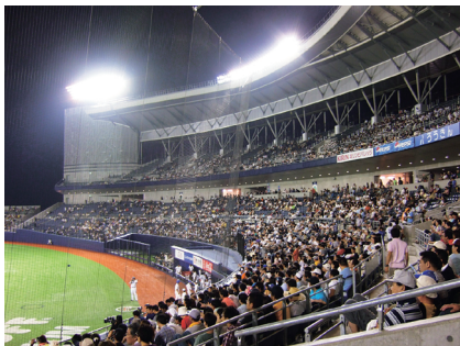
プロ野球セ・リーグ公式戦 横浜ベイスターズvs中日ドラゴンズ 9月5日、6日 ハードオフ エコスタジアム新潟で開催

当期後半につきましては、国内景気にやや持ち直しの兆しは見られるものの、内需低迷の長期化に伴い、放送事業に大きな影響を及ぼす広告市況の不透明感には拭えないことから放送業界を取り巻く経済情勢の急速な回復は期待できず、厳しい環境が続くものと予測されます。