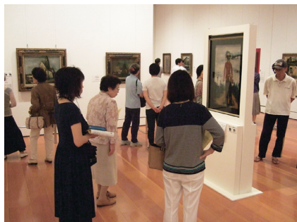
「佐伯祐三展 一バリエで天道した天才画家の道一」 7月4日～8月30日 新潟県立万代島美術館で開催