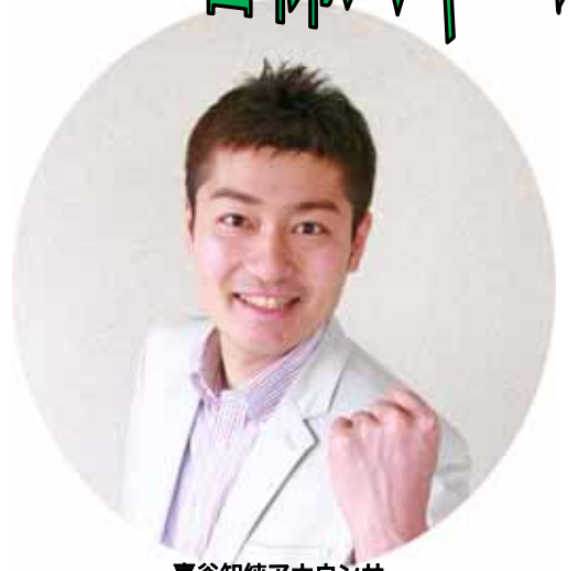
喜谷知純アナウンサー