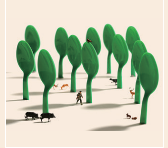
ハングリーハンター (2017年)

Instagramのフォロワーは330万人を超え、世代や文化を越えて世界中で人気を博しています。本展は、全国で150万人以上を動員した「MINIATURE LIFE展」の第2弾です。代表作を含む写真作品約120点と実物のミニチュア作品約50点を紹介し、田中達也のユニークな作品世界の魅力や制作の秘密に迫ります。