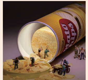
掘っても掘っても止まらない食欲 (2017年)