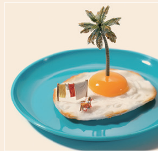
マミーサイドアップ (2016年)

1981年熊本生まれ。2011年、ミニチュアの視点で日常にある物を別の物に見立てたアート「MINIATURE CALENDAR」を開始。以後毎日作品をインターネット上で発表し続けている。主な仕事に、2017年NHKの連続テレビ小説「ひよっこ」のタイトルバック、2020年ドバイ国際博覧会 日本館展示クリエイターとして参画、など。Instagramのフォロワーは330万人を超える(2021年10月現在)。著書に「MINIATURE LIFE」、「Small Wonders」、「MINIATURE TRIP IN JAPAN」、「MINIATURE LIFE at HOME」など。🌐 https://miniature-calendar.com/