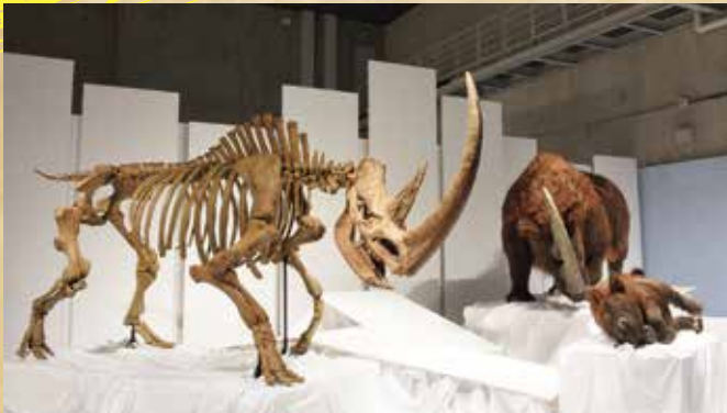
・チベットケサイ 展示イメージ

超大型獣「チベットケサイ」の全身復元骨格と生体復元モデルを通して、新説「アウト・オブ・チベット」を紹介し、哺乳類の進化の秘密に迫ります。