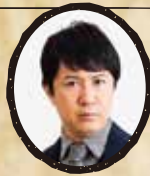
ハカセ・杉田智和さん