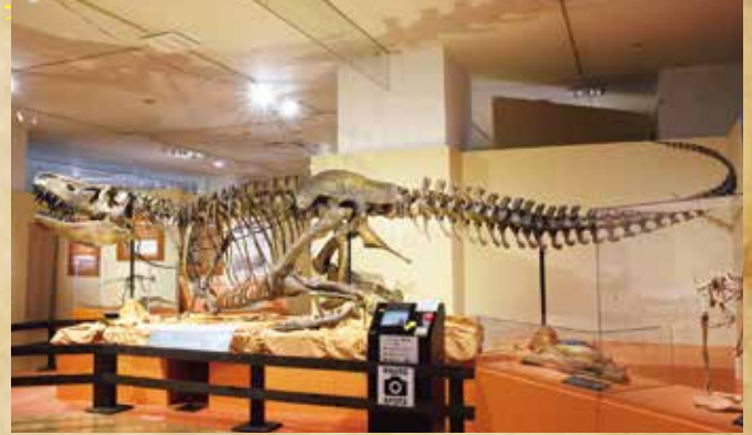
・タルボサウルス全身骨格 国立科学博物館蔵

アンドリュースの探検から時を経て、各国の調査隊がゴビ砂漠へと向かい、数多くの新種の化石を発見しました。アジアの大型肉食恐竜や、日本・モンゴルの調査隊が発見した化石の数々を展示します。