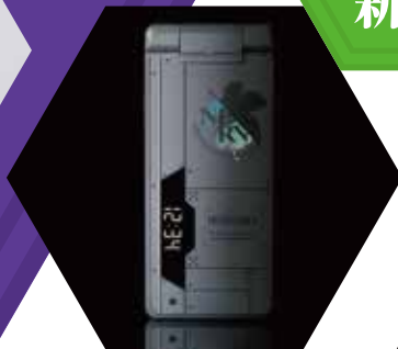
話題になった商品も多数展示