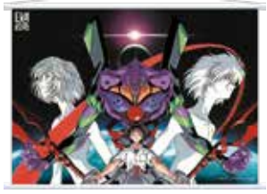
●B2タペストリー(全9種) 3,500円(税込)