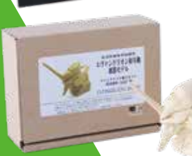
作画スタッフが実際に使用した 作画参考用立体資料のレプリカモデル