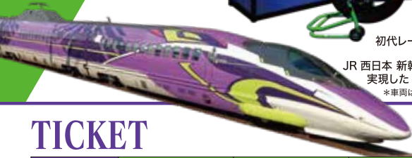
JR 西日本 新幹線とのコラボレーションで 実現した「500 TYPE EVA」 *車両は展示しません