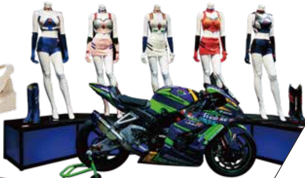
初代レースクイーンの衣装とレーシングバイク