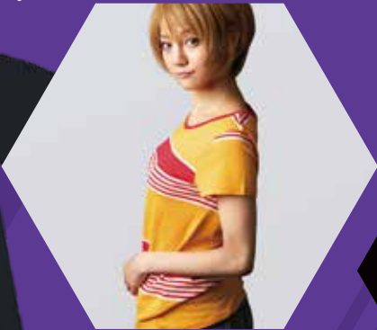
モチーフとなる色や文字だけで作られた商品もエヴァならではの