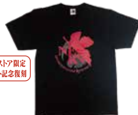
エヴァストア限定 イベント記念復刻