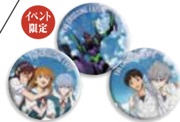
●毎バジセット/メインビジュアル 1,200円(税込)

最新のアイテムはもちろん、往年の人気商品の復刻、幅広いカテゴリの商品が過去最大級の規模で勢揃い。新潟限定グッズも販売!