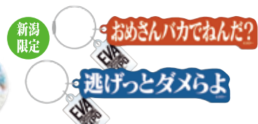
●アクリルキーホルダー(全2種) 600円(税込)