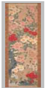
伊藤若冲「菊虫図」 展示会場:みなとびあ