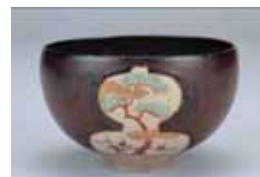
野々村仁清 「柿釉瓢抜色絵松竹梅茶碗」 展示会場:みなとびあ

京都・相国寺二大コレクションともいえる江戸時代の京都画壇を代表する二大画家、伊藤若冲と円山応挙の作品を中心に、金閣寺・銀閣寺に伝わる茶道具など、数々の名宝を紹介します。伊藤若冲は、近年、国際的にも「奇想の画家」として注目を集める人気画家。濃彩で細密な花鳥画や洒落な水墨画で独自の画風を作り上げました。円山応挙は、江戸時代中期、中国画や西洋画の技法を取り入れて新たな「写生画」を創造した近代日本画の祖ともいわれています。伝来の寺宝を含めた相国寺・承天閣美術館の全容がうかがえる絶好の機会となります。会場は、新潟市歴史博物館(みなとびあ)と新潟市會津八一記念館。展覧会の詳細は、BSNホームページへ。作品展示に関しては、各会館へお問い合わせください。